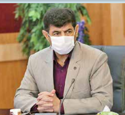
کارگران آن کارگاه چه خواهد شد؟ به استناد تبصره ماده ۲ قانون بیمه بیکاری چنانچه بر اثر حادثه غیر مترقبه از قبیل سیل، جنگ، زلزله و ... در صورت موقت کارگاه ها تعطیل گردند می بایست به بیمه شدگان آنها مقرری بیمه بیکاری پرداخت گردد. لذا شیوع ویروس کرونا هم حادثه غیر مترقبه بوده و بیمه شدگان کارگاه های توانند به ادارات تعاون، کار و رفاه اجتماعی مراجعه و جهت برقراری مقرری بیمه بیکاری ثبت نام نموده تا پس از طی فرایند های قانونی اقدام لازم در خصوص پرداخت مقرری بیکاری انجام پذیرد.