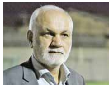
راههای اصلی بین شهرها و فرعی روستاها و مطالعه و اجرای خطوط ریلی و اتصال به راه آهن اصلی کشور نیز از مطالبات به حق مردم میباشد.

بانوجهبده آغاز مجلس یازدهم حضور نمایندگان منتخب مردم استان بوشهر در مجلس شورای اسلامی، لازم است توجه آنان را به مشکلات حال حاضر در حوزه های انتخابیه ۴ گانه استان جلب نمایم، تا بر اساس اولویت نسبت به جذب بودجه و اعتبارات لازم اقدام گردد. یکی از مهم ترین مشکلات استان تأمین آب آشامیدنی سالم و بهداشتی بوده که در طول سال و ویژه در فصول بهار و تابستان مشهود میباشد که زندگی مردم استان را تحت الشعاع خود قرار داده است و پیگیری و رفع این یابی و طرحهای آبیخیز داری جهت تأمین آب زراعی و کشاورزی نیز مبیستمد نظر قرار داده شود. اجرای طرحهای مربوط به حمل و نقل، احداث و تکمیل